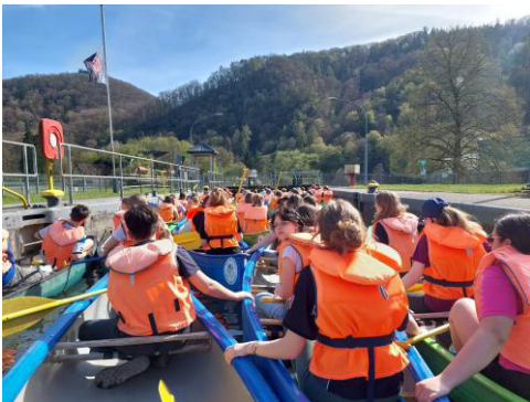
Mit 27 Kanus in der Schleuse–vorher...