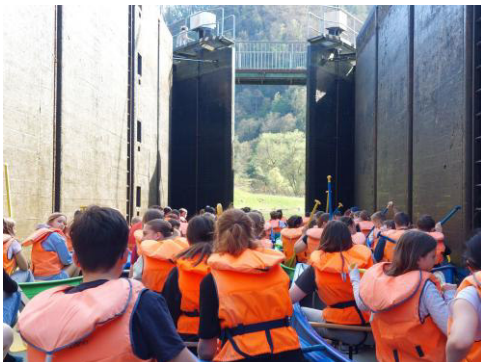
... und nachher.